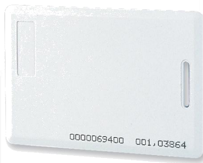
CP - CPE